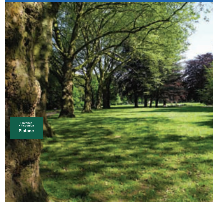
Platanus x hispanica Platane